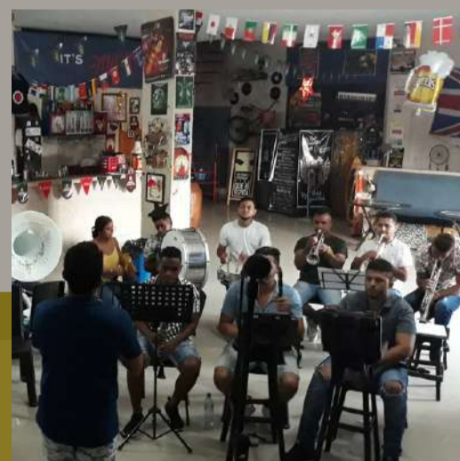
Foto: Ensayo de la banda en Cartagena