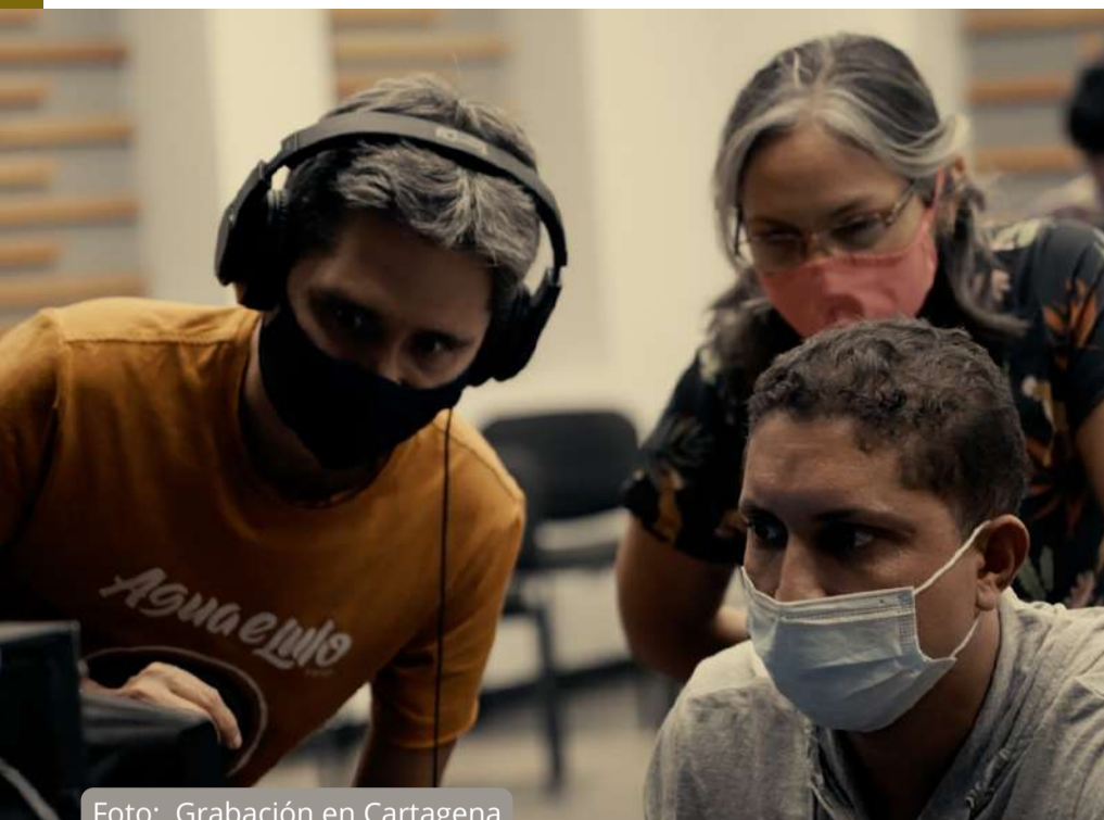
Foto: Grabación en Cartagena