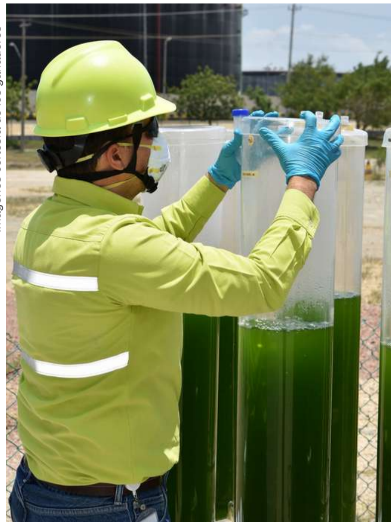
Foto: Fotoreactores, Microalgas para biocombustibles Santiago Betancur, ARGOS | 2021