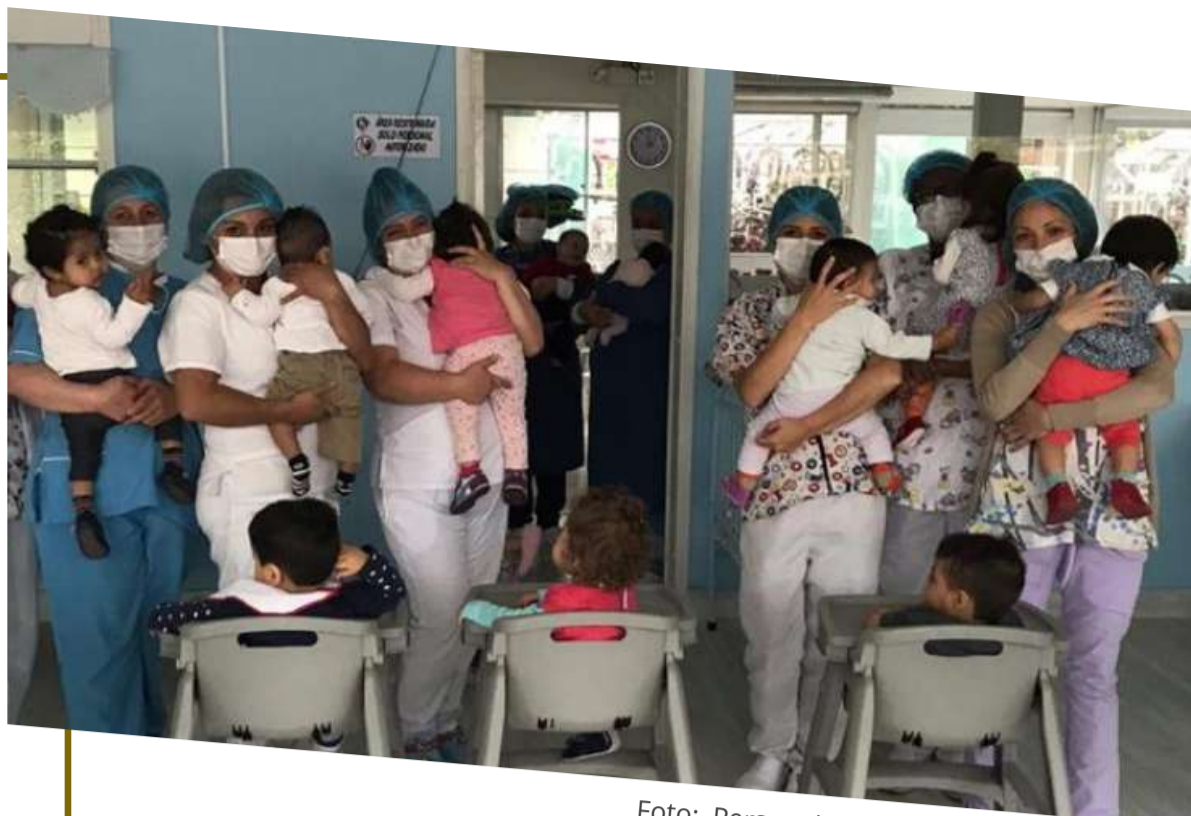
Foto: Personal de Sala Cuna con los bebés