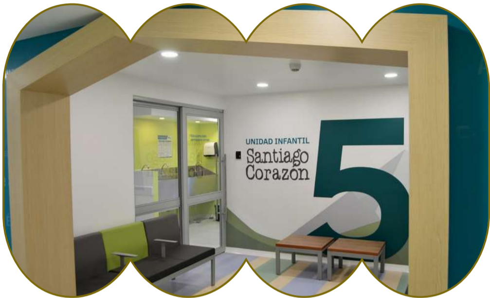
Foto: Ingreso Unidad Infantil Santiago Corazón - Hospital San Vicente Fundación