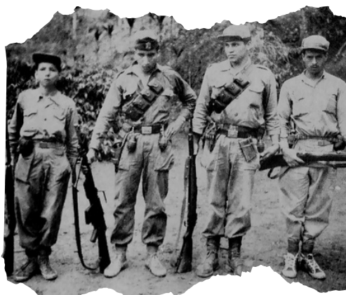
Foto: Presencia femenina en la guerra

"Además de la altísima calidad de esta investigación, la coincidencia histórica de conmemorar los 60 años de la publicación de La violencia en Colombia de Monseñor Germán Guzmán, Orlando Fals Borda y Eduardo Umaña." Jurado evaluador