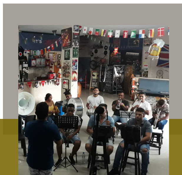
Foto: Ensayo de la banda en Cartagena