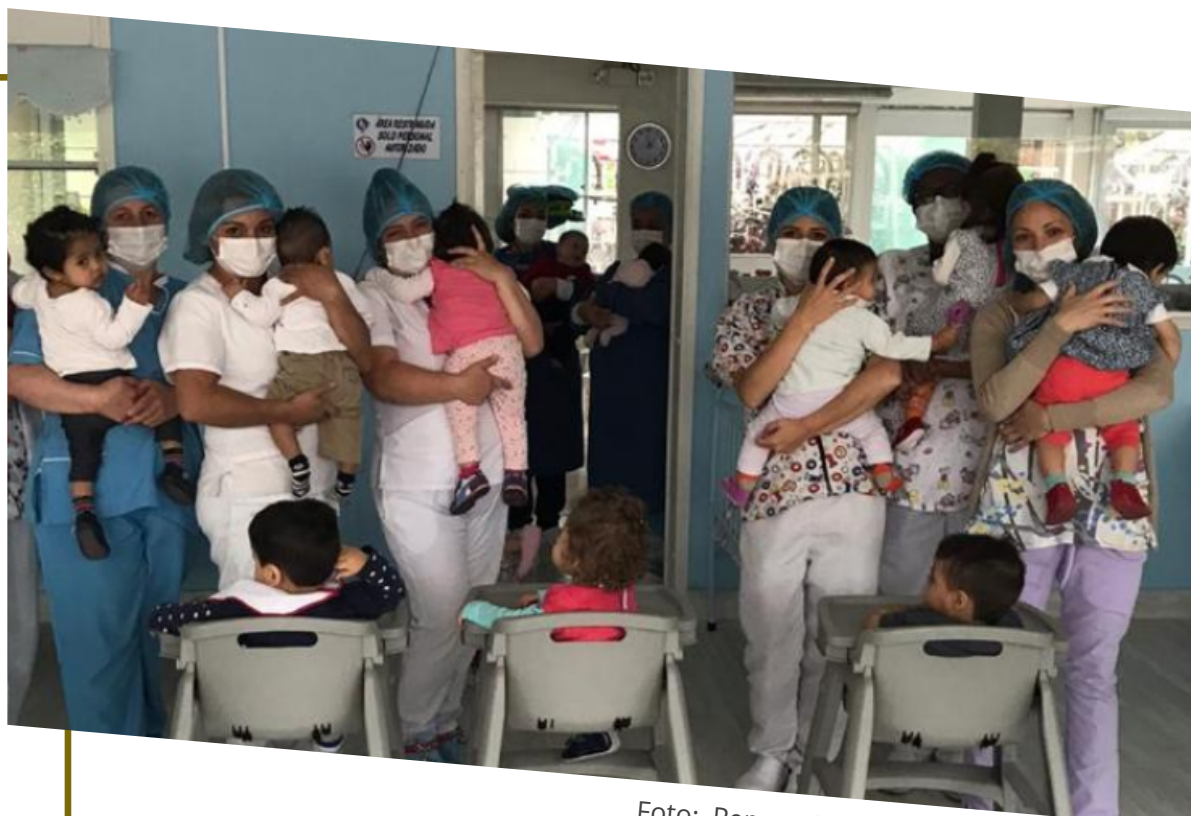
Foto: Personal de Sala Cuna con los bebés